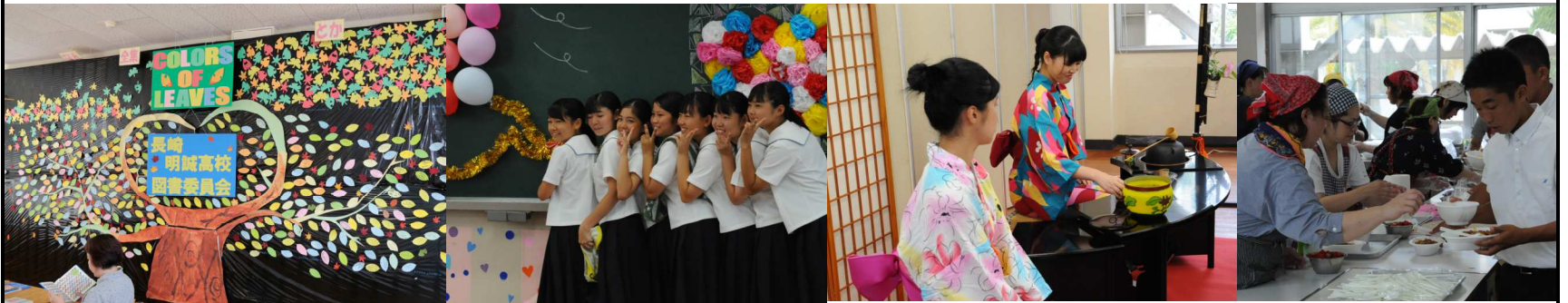
【展示】部活動や授業の展示、クラス企画の展示やイベント。【PTAバザー】『夢あり亭』カレー・うどん、美味しかったです！