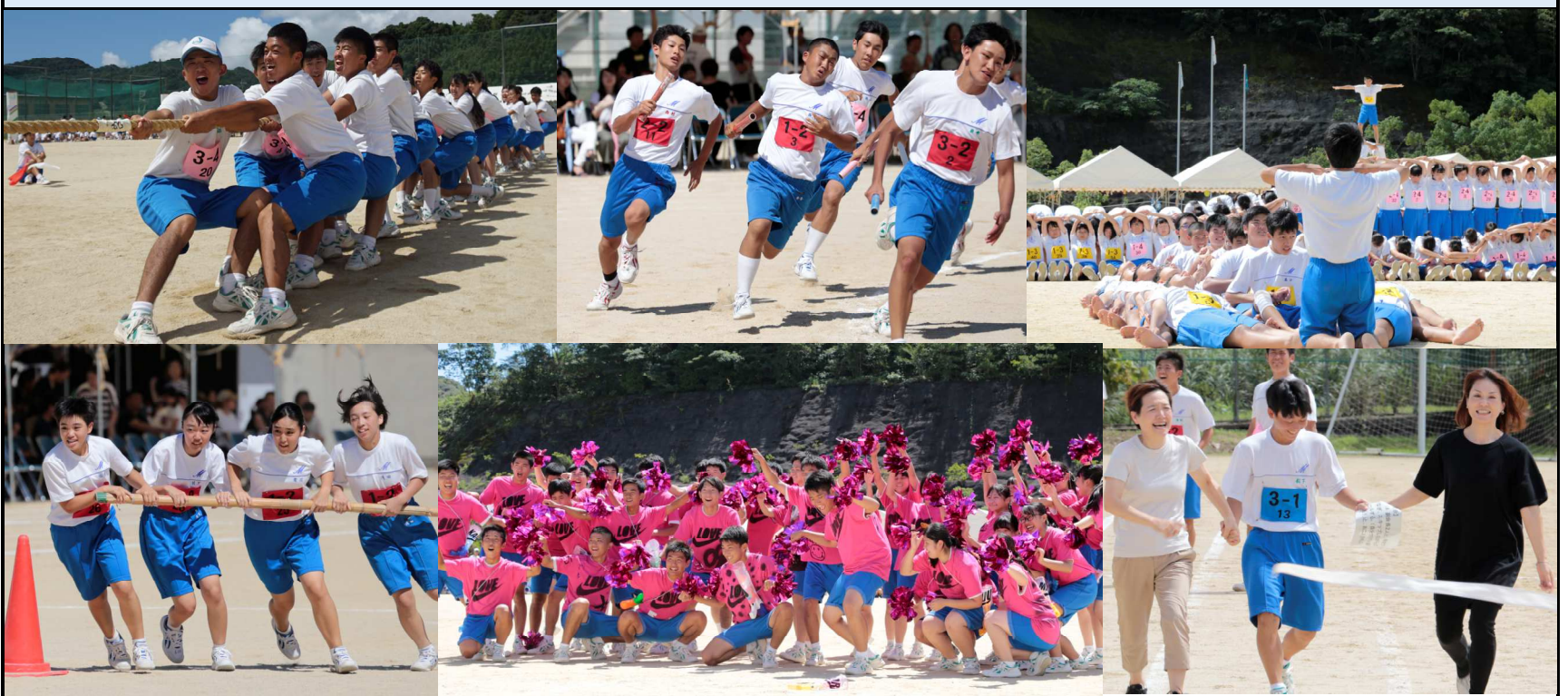
早朝の雨も上がり、青空と生徒たちの笑顔がまぶしい体育の部でした。勝利を目指して懸命に走り、互いを応援する姿、感動しました！