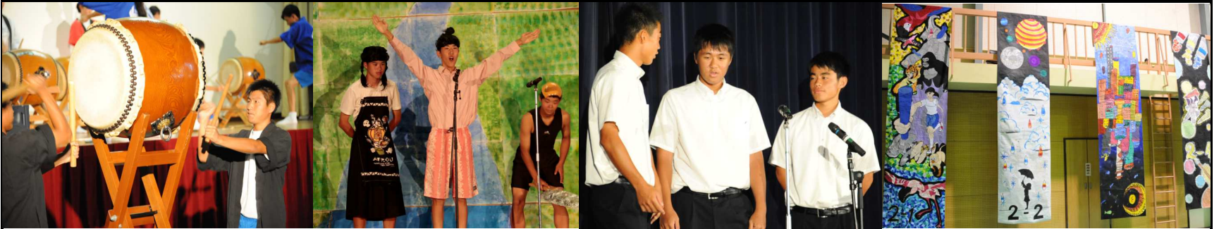
【ステージ】授業成果の発表や文化部の発表、クラス企画の劇『桃太郎』。団別対抗PR合戦『幕間でGO』は3年生が盛り上げました！