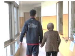
デイサービスいきいき

2月12日(火)~14日(木)、1年生全員波佐見町及び佐世保市内の32事業所で、インターンシップをさせていただきました。ご協力いただいた事業所の皆様、ありがとうございました。