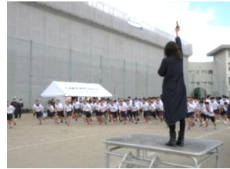
男子スタート スターター：母の会副会長

2月1日(金)ロードレース大会が実施され、男子は12km、女子は8kmの距離で健脚を競いました。途中棄権者もなく、参加者全員が走り終え、みんなの頑張りを見ることができた大会でした。最後は、PTA母の会の皆さんが作ってくださった、豚汁とおにぎりをいただきました。本当にありがとうございました。