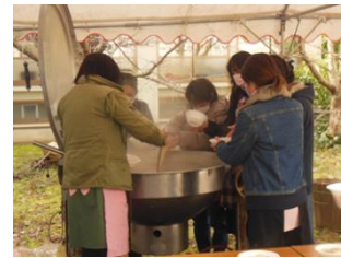
豚汁を大釜2杯、作っていただきました。