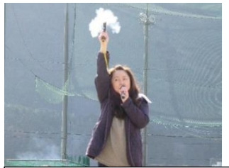
女子スタート スターター：母の会会長様