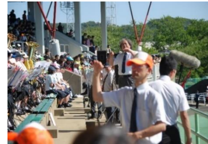
開会式では、吹奏楽部も佐世保地区の他校と一緒に進行曲を演奏しました。