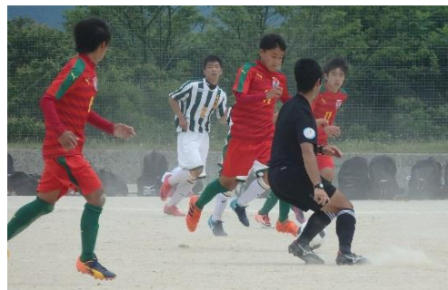
サッカー一部2回戦 対 長崎南