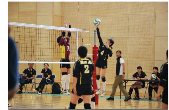
バレーボール女子 対 島原