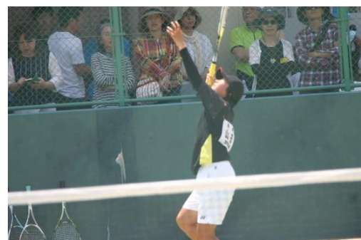
ソフトテニス女子 対 長崎東