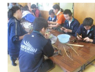
ちまき作りも教えていただきました。