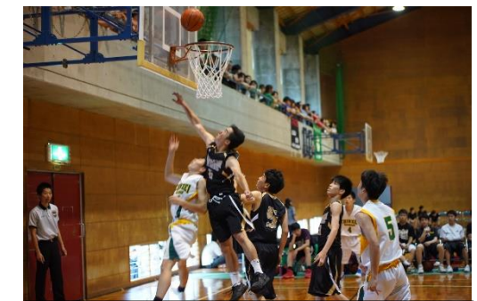
バスケットボール 対 鎮西