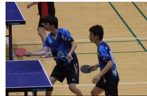
卓球(団体) 対 北松農業