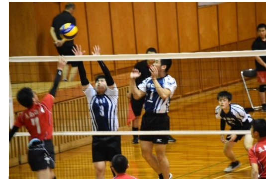
バレーボール男子 対 五島海陽