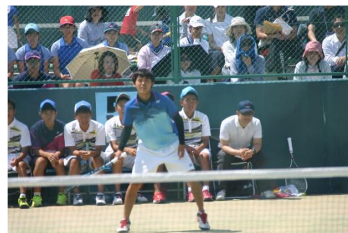
ソフトテニス男子 対 諫早