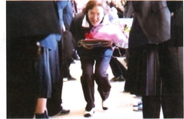
神宮先生ありがとうございます