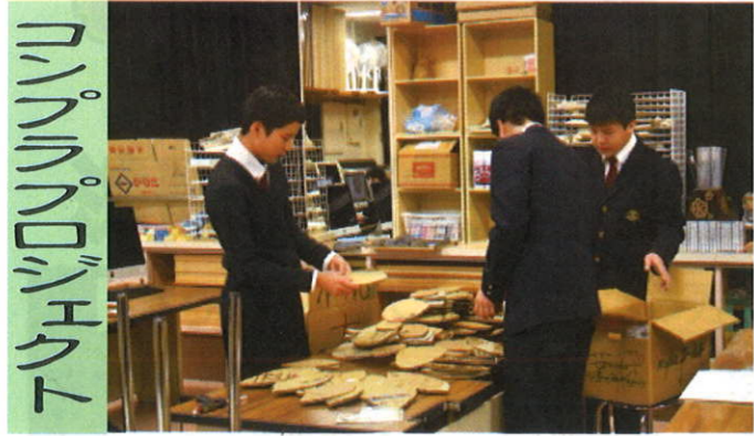
パンパノミックアート