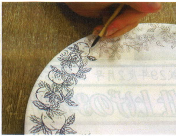
伝統工芸士による 絵付け指導