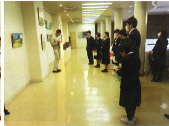
長崎県高等学校 佐世保美術展交流会