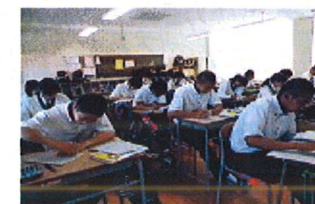
2年 簿記 3級クラス