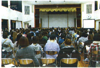
満員の賑わい 改善センター