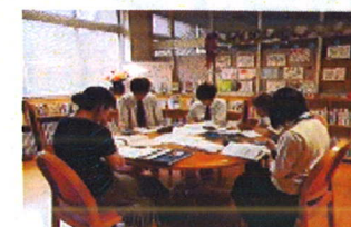
3年 簿記 1級クラス