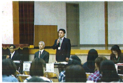
本校でのPTA会長挨拶