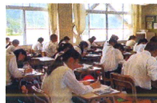
1年 ビジネス基礎(電卓)