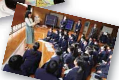
キャリア教育 「カタリバ」