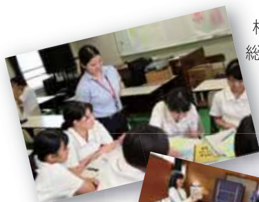
松浦市×松浦高校 総合学習「まつナビ」