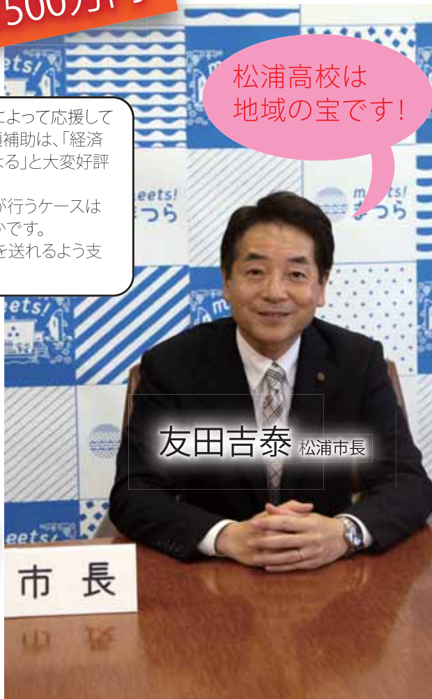
友田吉泰 松浦市長