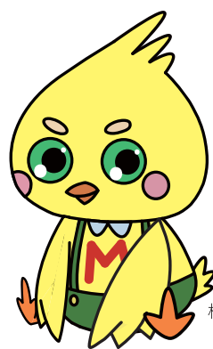
松浦高校マスコット「まつどりー」

語尾に「~なのだ」が口癖で、好奇心旺盛! 最近は、松浦市が着ぐるみをつくってくれて、ゆるキャラグランプリにも出場しているよ!