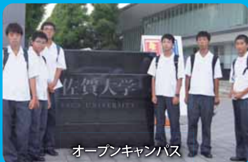
オープンキャンパス