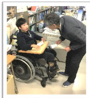
校長先生にセールス中。2つ販売しました。