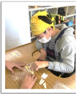
みそを入れるビニール袋にラベルを貼ります。しわが入らないように慎重に指先を動かしました。