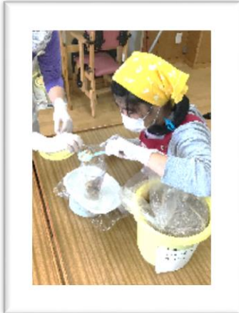
計量はばっちりです。

2月1日(金)に行われるみそ販売会に向けた準備が急ピッチで行われている。25日(金)の学習では、販売会場に設置する「作り方」の説明資料作成係、みそを計量してビニール袋に詰める係、商品のラベルを貼る係、販売促進係などに分かれて作業が行われた。発売日まで残り1週間。あとは、会場作りと、接客練習だ。80個完売を目指して頑張れ！