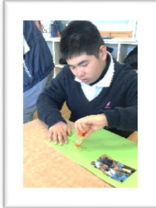
鉛筆で印が付けられた箇所を目印に糊を塗りました。