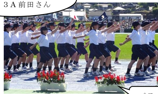
プランターのお花は北農提供でした♪