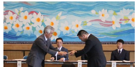
城校長(左)より持永前会長(右)へ記念品の進呈がなされました