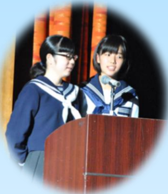
今年も放送部が、橄欖祭の 進行を務めてくれました。