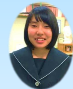
ポスターデザイン 石榮 愛主 さん (1-3)