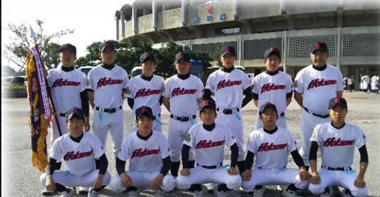
沖縄：北谷球場にて

4月21日(金)～4月25日(火)まで沖縄で第49回九州地区高等学校軟式野球大会が実施され、熱戦が繰り広げられました。九州大会では2回戦で強豪鹿児島実業高校と対戦し、本校は奮戦しましたが、試合を優位に進める実戦慣れした相手校に惜しくも敗れてしまいました。本校投手もここまで1人で投げぬいてきましたが、本来の調子が出ず本来の力が出せないまま敗れてしまい、部員全員大変悔しい思いをしました。