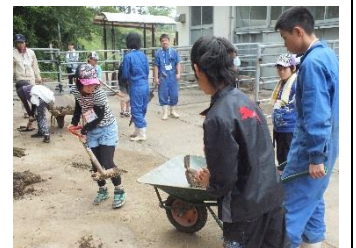
昨年の様子・体験)

左の表には、7月上旬までの分をおのせしています。不明な点がございましたら、学校までご一報ください。