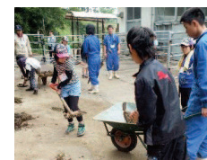
昨年の様子(飼育体験)

しています。定員は平戸市内の小学生30名程度です。本校のウサギ、ヤギ、ミニブタ、ヒツジなどを教材とし、動物科学部の生徒達が中心となって指導します。 応募、詳細については田平中央公民館まで