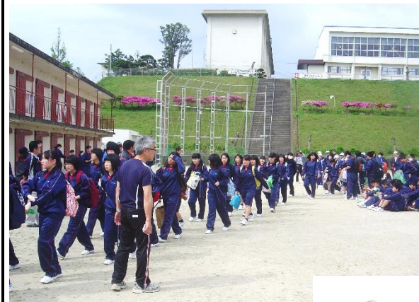
クラスで拾ったゴミを計量

北農を出発して、学年別に3つのコースのゴミ拾いをしながら中瀬草原を目指しました。到着後、権現太鼓部の演奏披露や、クラス対抗伝言ゲームがありました。なんとか天気が持ちこたえてくれたお陰で、爽やかな1日を過ごすことができました。企画、準備、後片付けまで活躍してくれた農業クラブ役員の方々の皆さん、お疲れ様でした！