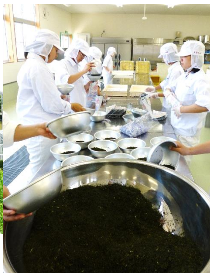
↑火入れが終わったお茶を袋詰め