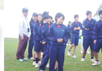
歓迎行事の伝言ゲーム 次の人にちゃんと伝わった？